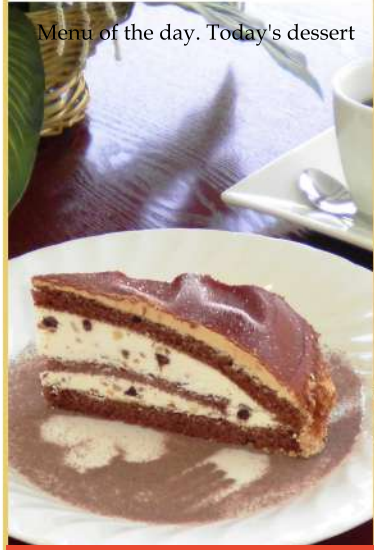
Menu of the day. Today's dessert