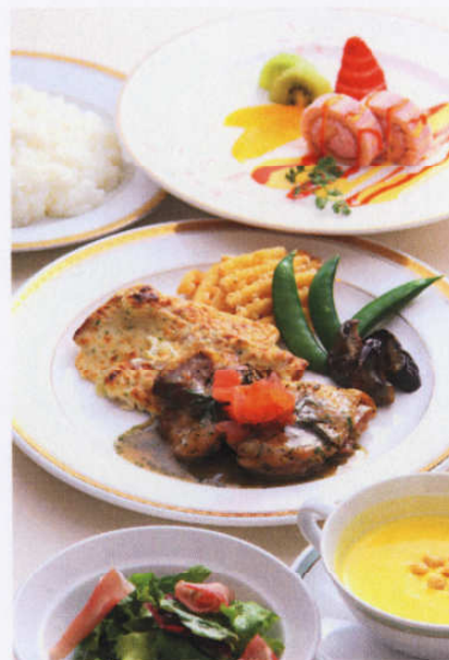
お肉料理のイメージ