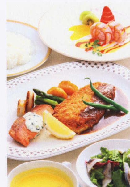
お魚料理のイメージ