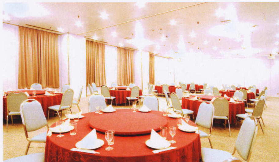
食事会場は専用会場でクラス別、男女別をお知らせ下さい。 (会場イメージ)